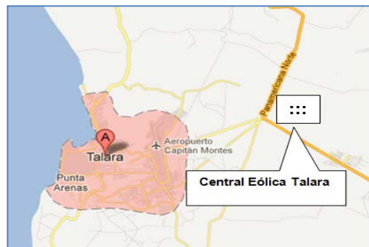
Plano de Ubicación