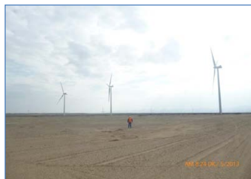
Vista de los aerogeneradores montados