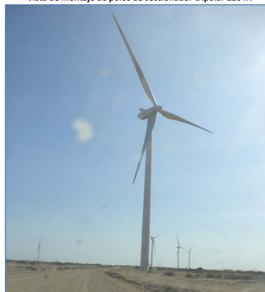
Segundo Aero Completo (Aero 9)