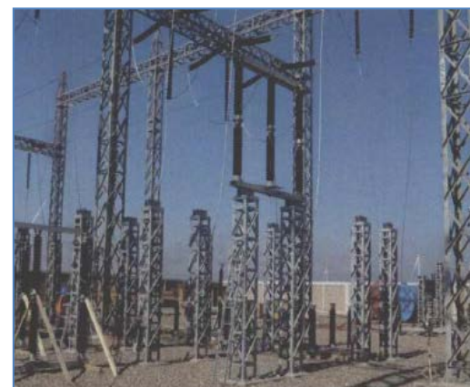
Vista de montaje de polos de seccionador tripolar 220 kV