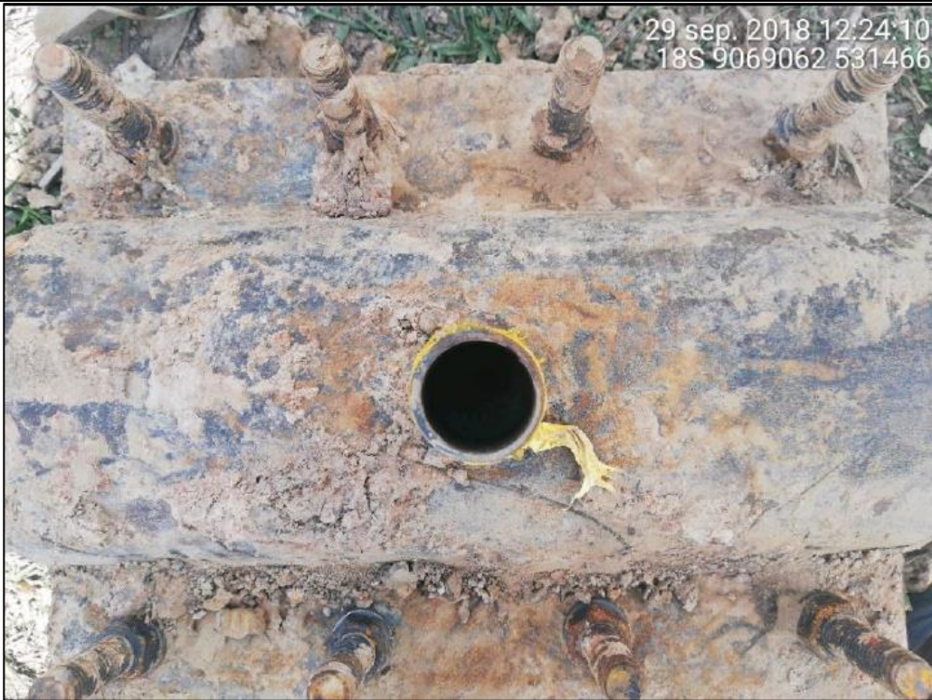
Figura 11: KP 77+800. Se puede observar con mayor detalle la grampa hechiza y el agujero de \frac{3}{4} " perforado para la extracción del LGN.