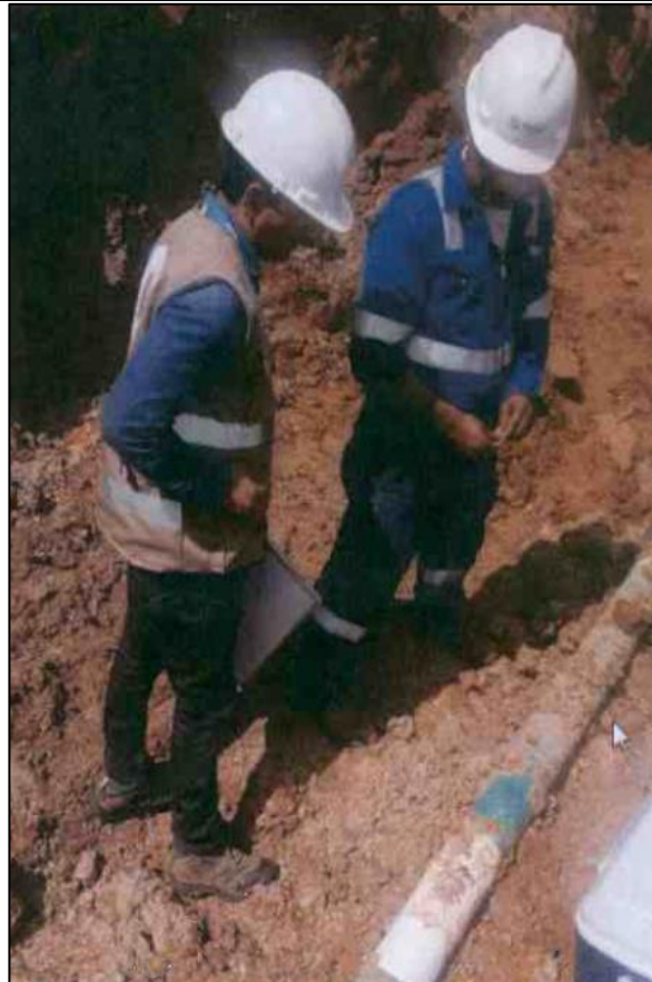
Figura 05: KP 77+800, actividades de reparación definitiva del ducto de LGN afectado.