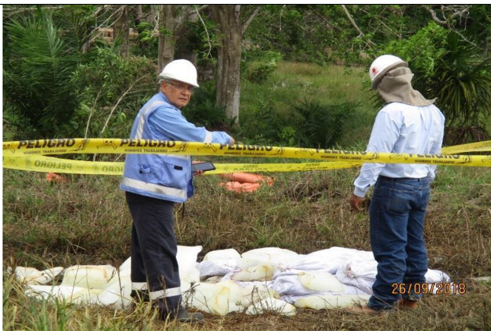
Figura 06: KP 77+800. Supervisión de Osinerghmin en la zona de la emergencia.