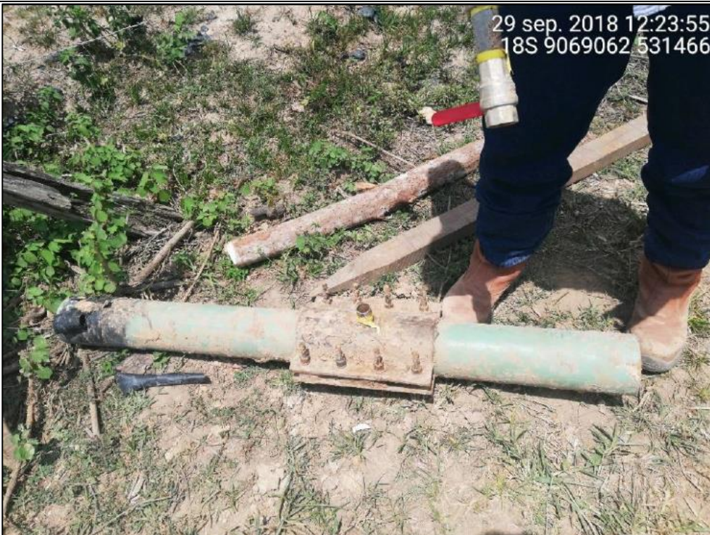
Figura 10: KP 77+800. Se puede observar la sección del ducto de 4" retirado y en ella se encuentra una grampa hechiza y un agujero de 3/4" perforado.