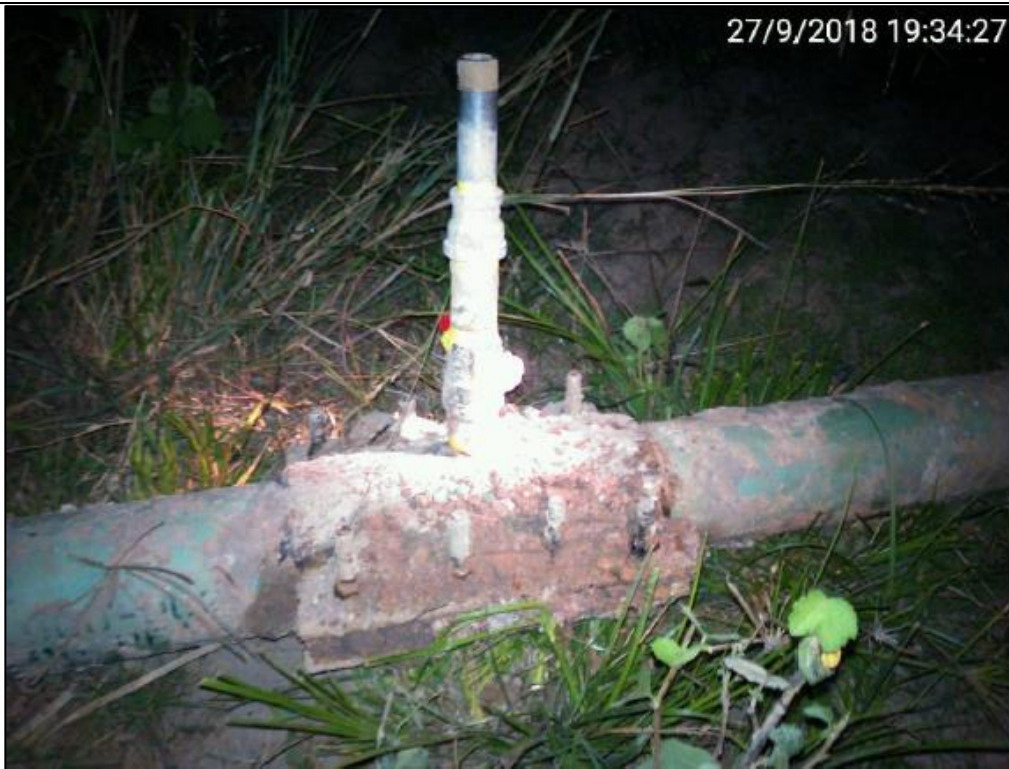
Figura 09: KP 77+800. Se puede visualizar la grampa hechiza y la válvula mecánica instalada para extracción del LGN.