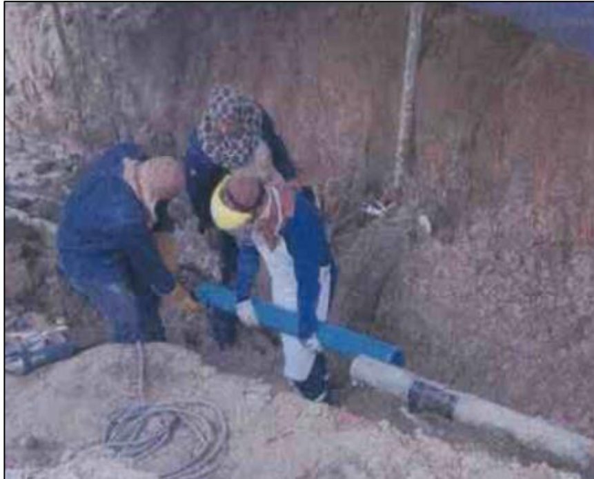
Figura 04: KP 77+800, vista de las actividades de reparación del ducto de 4" de LGN