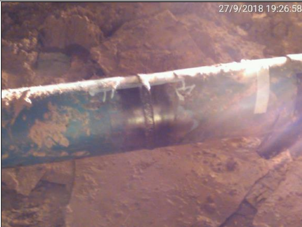
Figura 07: KP 77+800. Detalle del cordón de soldadura realizado como parte de las acciones de reparación.