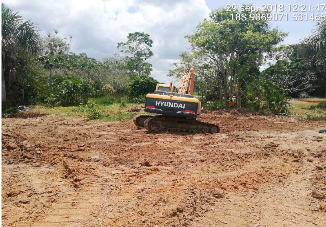
Figura 12: KP 77+800, trabajos de tapada y recomposición del terreno