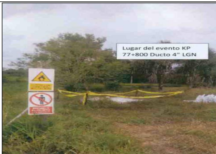
Figura 02: KP 77+800, señalización instalada alrededor de la zona donde se produjo el derrame de LGN

"Aproximadamente a las 11:05 hrs del día 25 de setiembre de 2018 se produjo una emergencia ambiental en el tramo ubicado entre Neshuya y nuestra Planta de Fraccionamiento, específicamente a la altura del Km 21 de la Carretera Federico Basadre. Ante este hecho, personal de nuestra empresa se dirigió a la zona del evento para constatar lo sucedido e inmediatamente se activaron los sistemas de control de emergencia del ducto y el plan de contingencia."