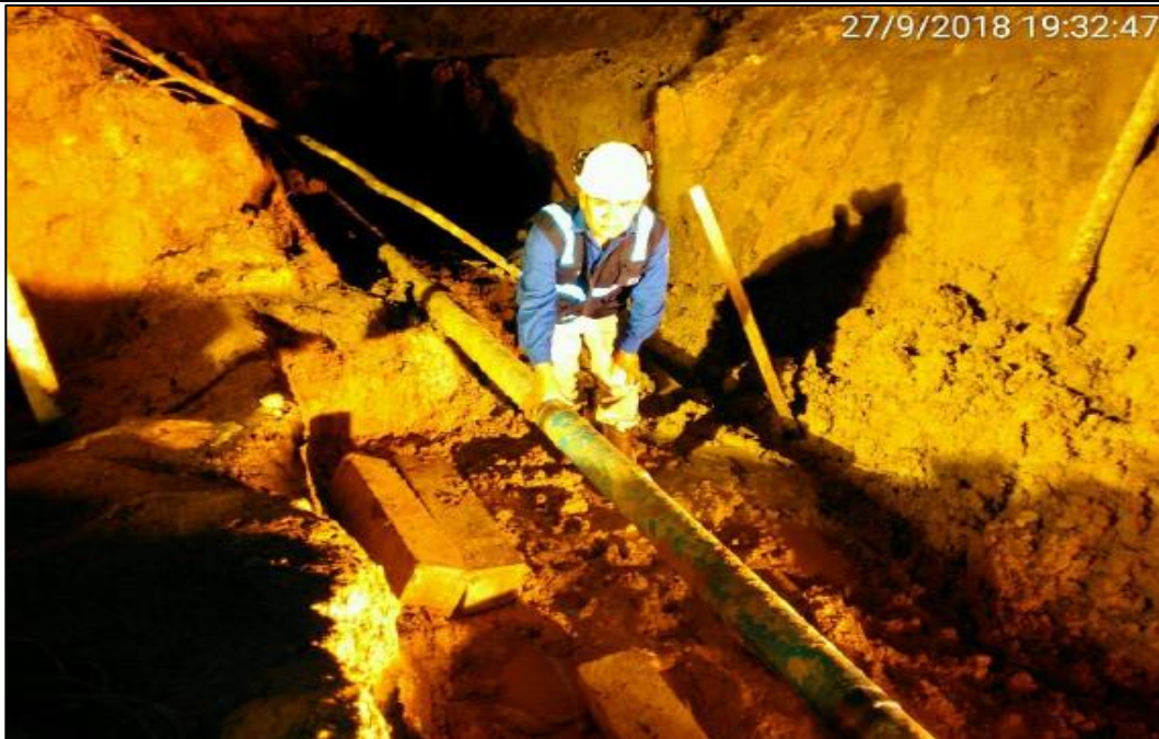
Figura 08: KP 77+800, Inspección visual del tramo reparado del ducto de LGN de 4".