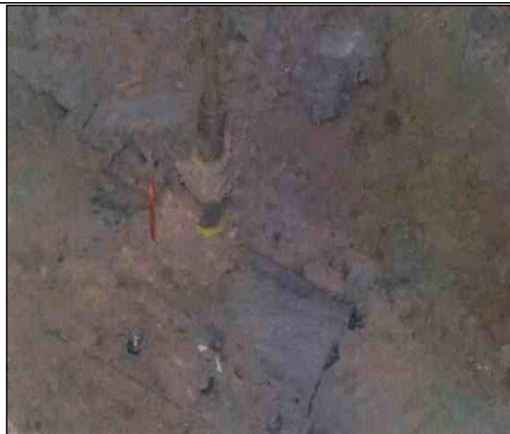
Figura 03: KP 77+800, conexión clandestina instalada en el ducto de 4" de LGN. Esta consistió en una grampa, niple y válvula