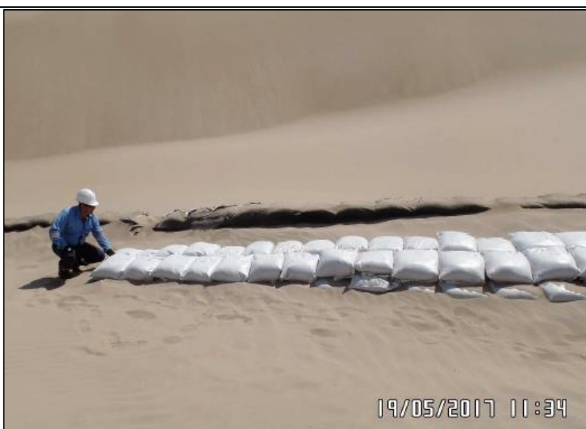
Figura 03: KP 530+977, Verificación de la colocación de sacos suelo en la zona donde se identificó la condición de riesgo.

La condición de riesgo, ocasionada por la acción eólica de los vientos de la zona, fue controlada y estabilizada al momento de la visita de supervisión de Osinerghmin.