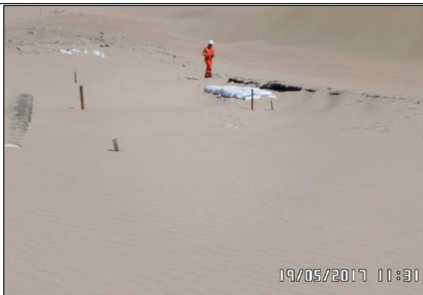
Figura 02: KP 530+977, protección de la tubería mediante el uso de sacos de suelo a fin de controlar la erosión eólica sobre esta.