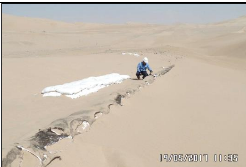
Figura 04: KP 530+977, verificación de la recuperación de tapada con material de la zona.