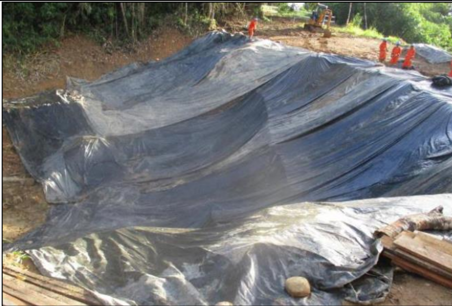
Figura 05: KP 019+550, zona cubierta con agropol para reducir la saturación del suelo por la precipitación pluvial.