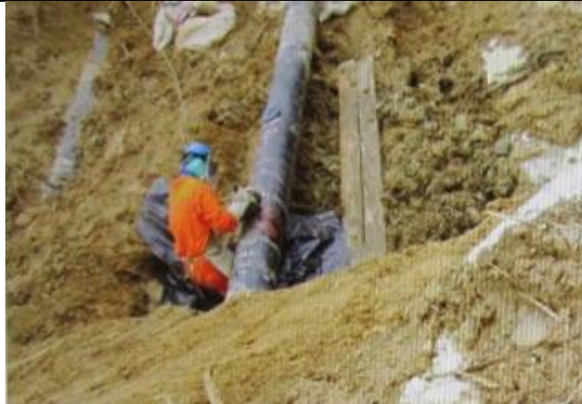
Figura 03: KP 19+550, Personal del área de ductos realizando trabajos en la junta J19/69 LGN.