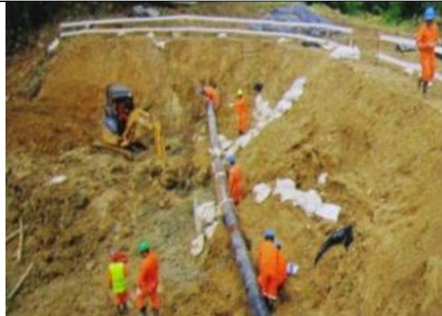
Figura 04: KP 19+550, trabajos de excavación por debajo del ducto hasta encontrar terreno firme para colocar soporte de saco-suelo por debajo del ducto de LGN.