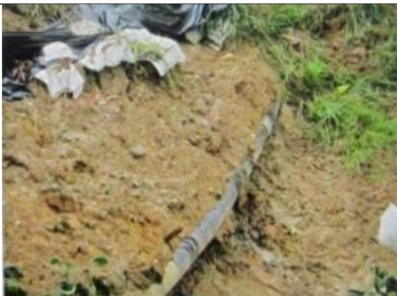
Figura 02: KP 19+550, vista de la exposición de los ductos de LGN a consecuencia de un deslizamiento rotacional.

Del relevamiento preliminar efectuado, TGP identificó que el nivel de riesgo fue "alto" por movimientos de falla de talud (deslizamiento rotacional).