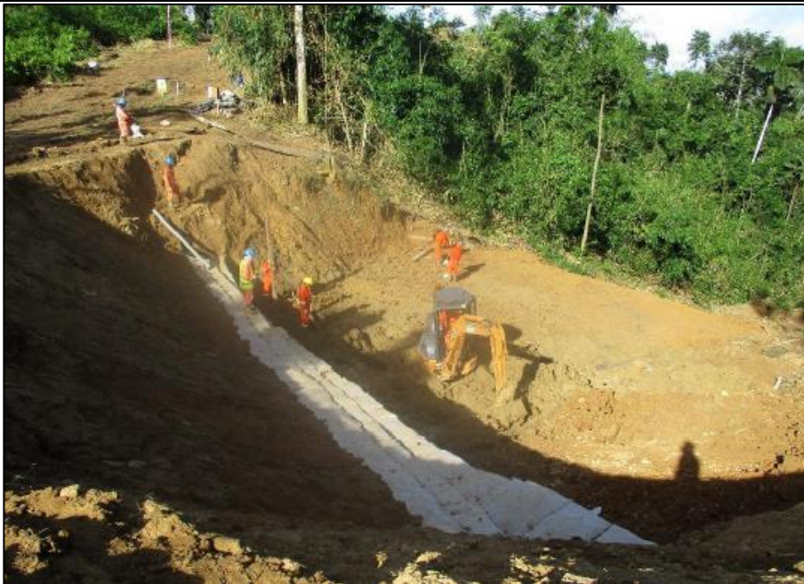
Figura 06: KP 019+550, trabajos de recomposición de la zona. Se realizó excavación de zanja e instalación de filtro francés para el manejo de aguas sub – superficiales.