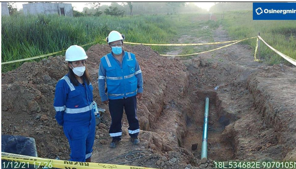
Figura 04: Vista panorámica de la zona de afectación al ducto en el KP 80+780 del tramo Estación Neshuya – Planta Fraccionamiento. Se aprecia el reemplazo del tramo afectado por daño por terceros.