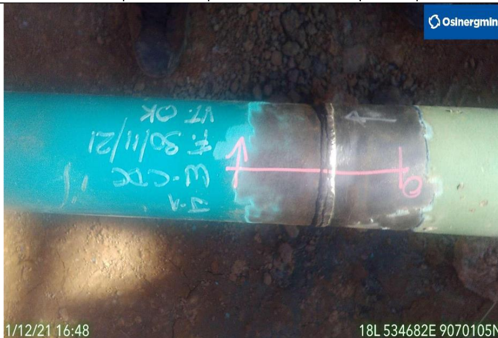
Figura 05: Vista de sección del ducto reemplazado en el KP 80+780 del tramo Estación Neshuya – Planta Fraccionamiento, se aprecia junta soldada aprobada.