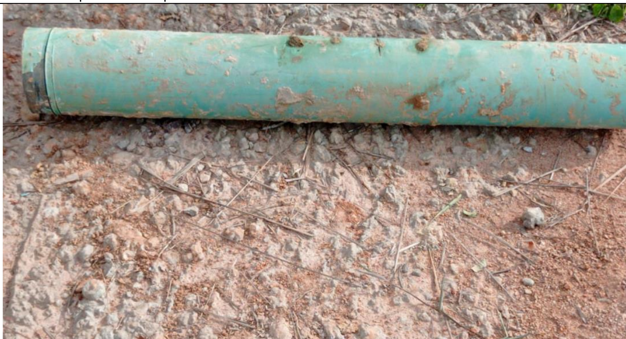
Figura 03: Vista de la sección del ducto retirado a la altura de la progresiva KP 80+780 del tramo Estación Neshuya – Planta Fraccionamiento.