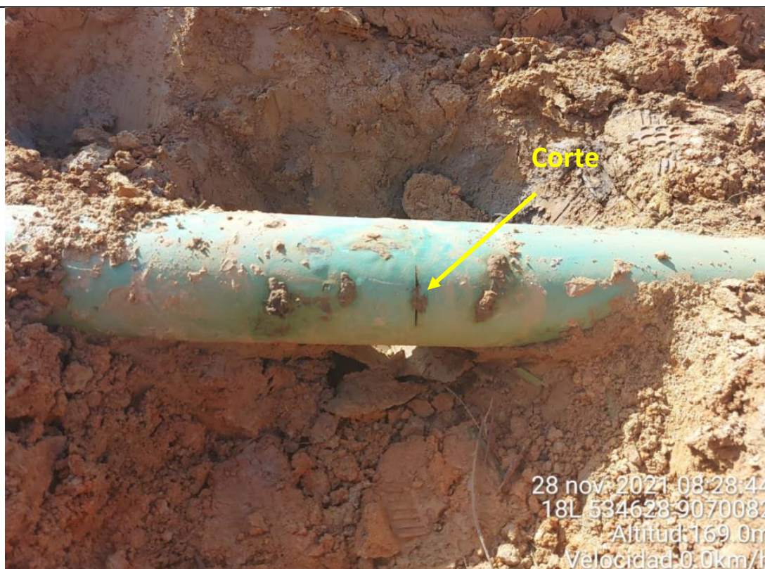
Figura 02: Vista de la condición de riesgo a la altura de la progresiva KP 80+780 del tramo Estación Neshuya – Planta Fraccionamiento.

Se ha desarrollado el nivel de riesgo en base a la Matriz Corporativa de la empresa la cual se presenta en el Anexo 1.2. El nivel de riesgo valorado es Alto. ”